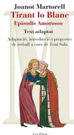
Tirant lo Blanc. Episodis amorosos. Joanot Martorell Edicions 62

Aquesta és la llista que ens envia la Generalitat. No facis cas de les pàgines que hi veuràs indicades paginació: pertany l'edició original del llibre, escrita en català del segle XV. Tu tens un llibre en versió reduïda i escrit en català actual i adaptat als alumnes de batxillerat. Per guiar-te millor, mira l'índex del llibre que llegiràs i que és aquest: